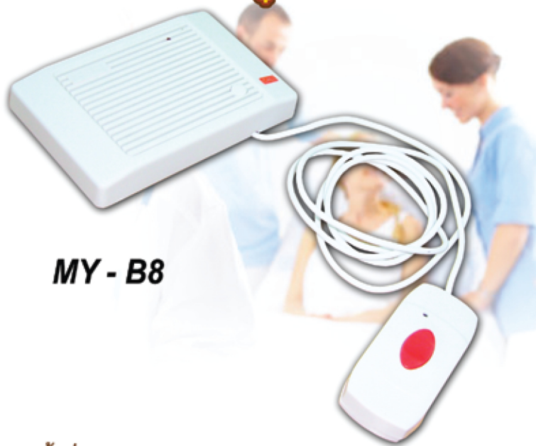
MY - B8